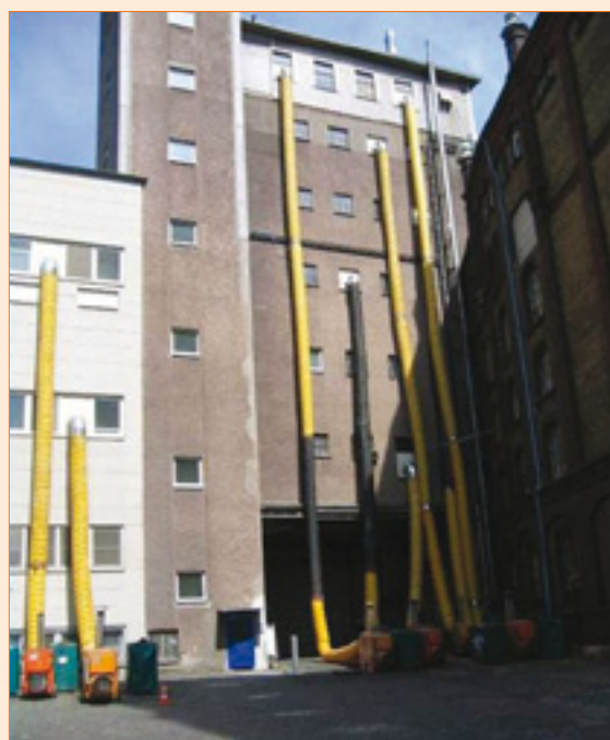
Entwässerung von Gebäuden