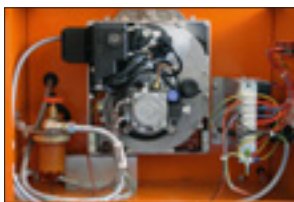
ISK®-Brenner mit original HEYLO-Ölvorwärmung