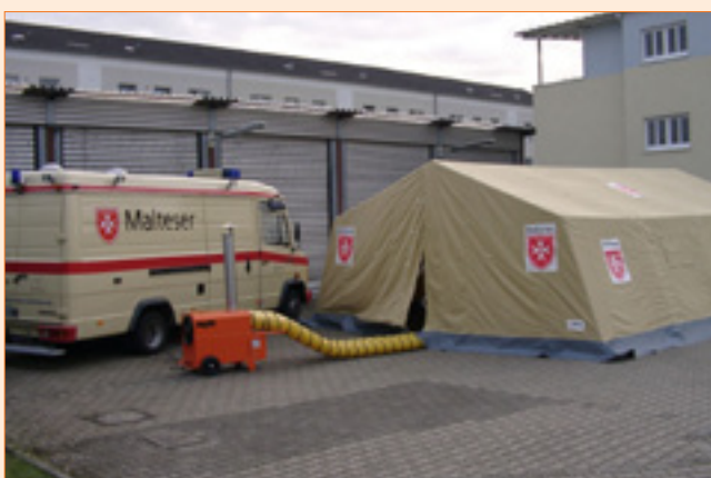
Temporäre Beheizung von Zelten