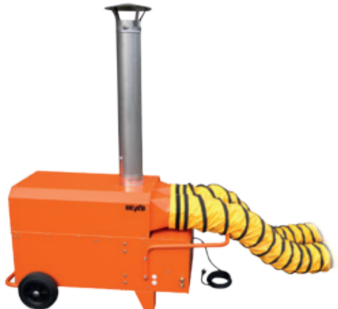
Gezielte Beheizung von zwei Räumen durch Anschluss von Warmluftschläuchen

Wirkungsgrad bis 93 % – Brennstoffersparnis bis 10 %!