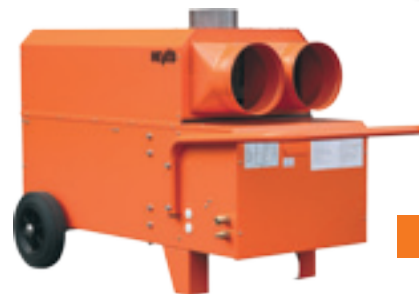
K 30/K 30 T

Wirkungsgrad bis 93 % – Brennstoffersparnis bis 10 %!