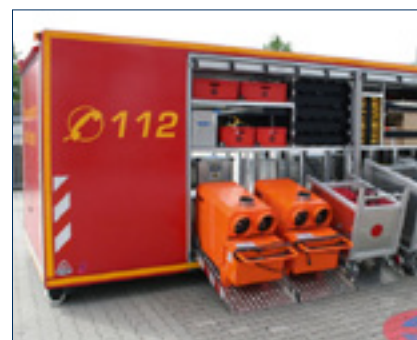
K 30 oder K 30 T: kompakt und effizient – für die härtesten Einsätze