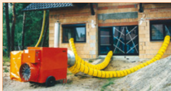
Beheizung in der Bauphase